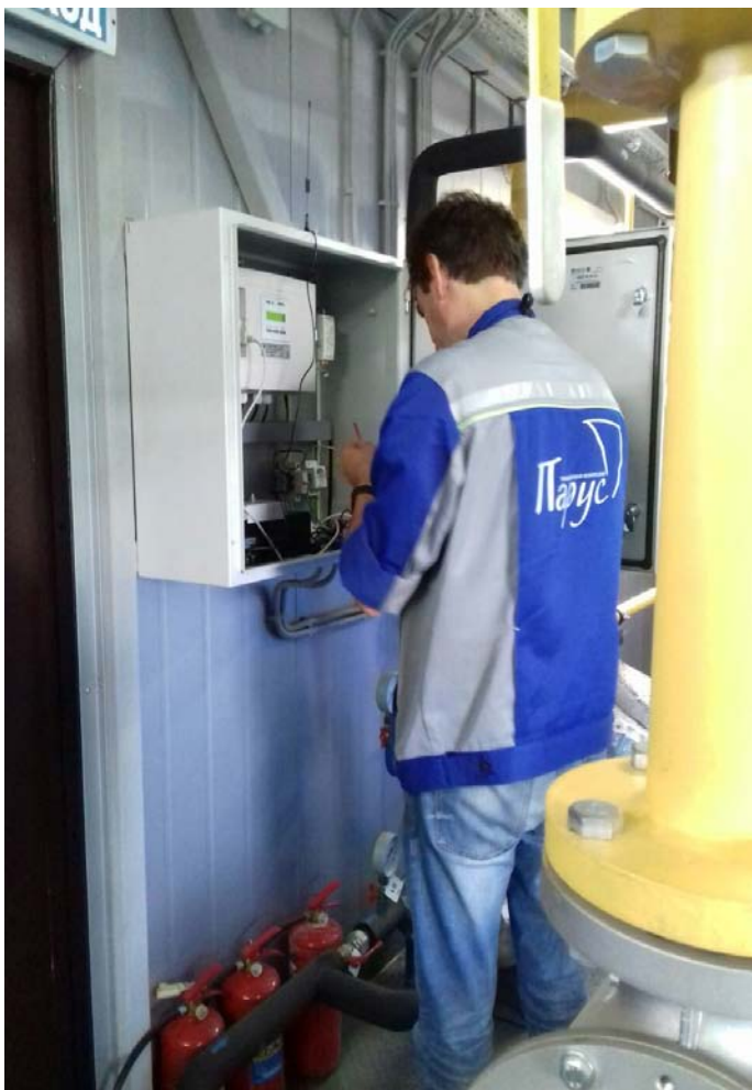
Замена автомата на клапане дымоудаления.