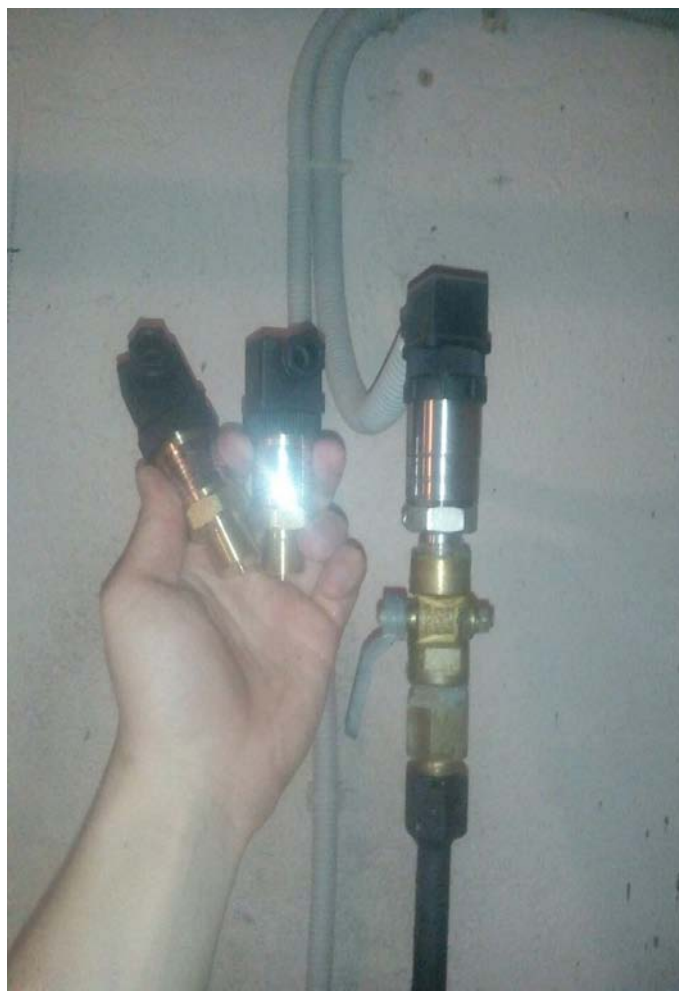
Замена датчиков давления.