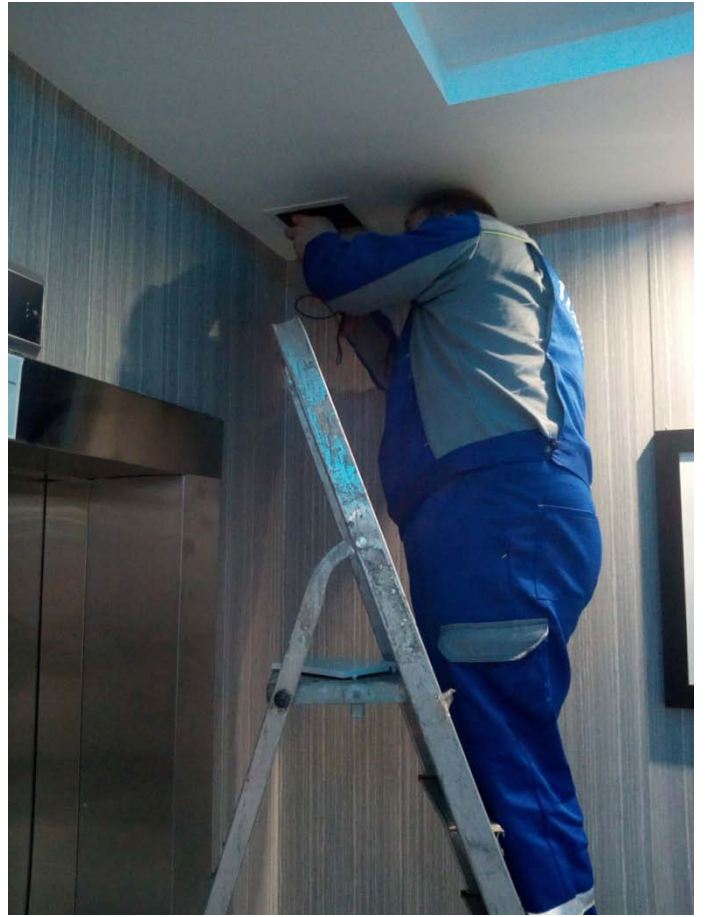
Ремонт противопожарных клапанов на системе вентиляции.