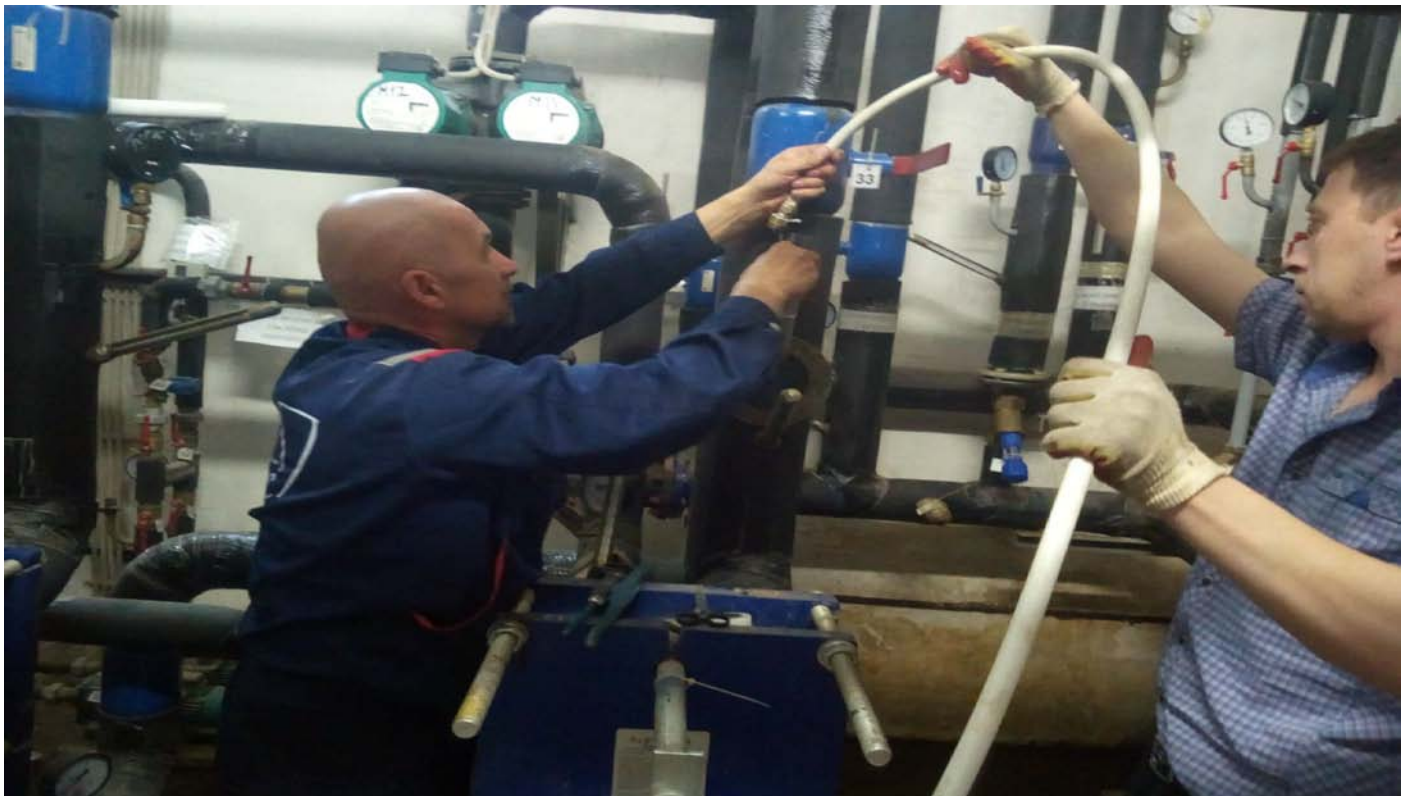
Промывка и опрессовка систем отопления и ГВС+сдача в ресурсоснабжающую организацию.