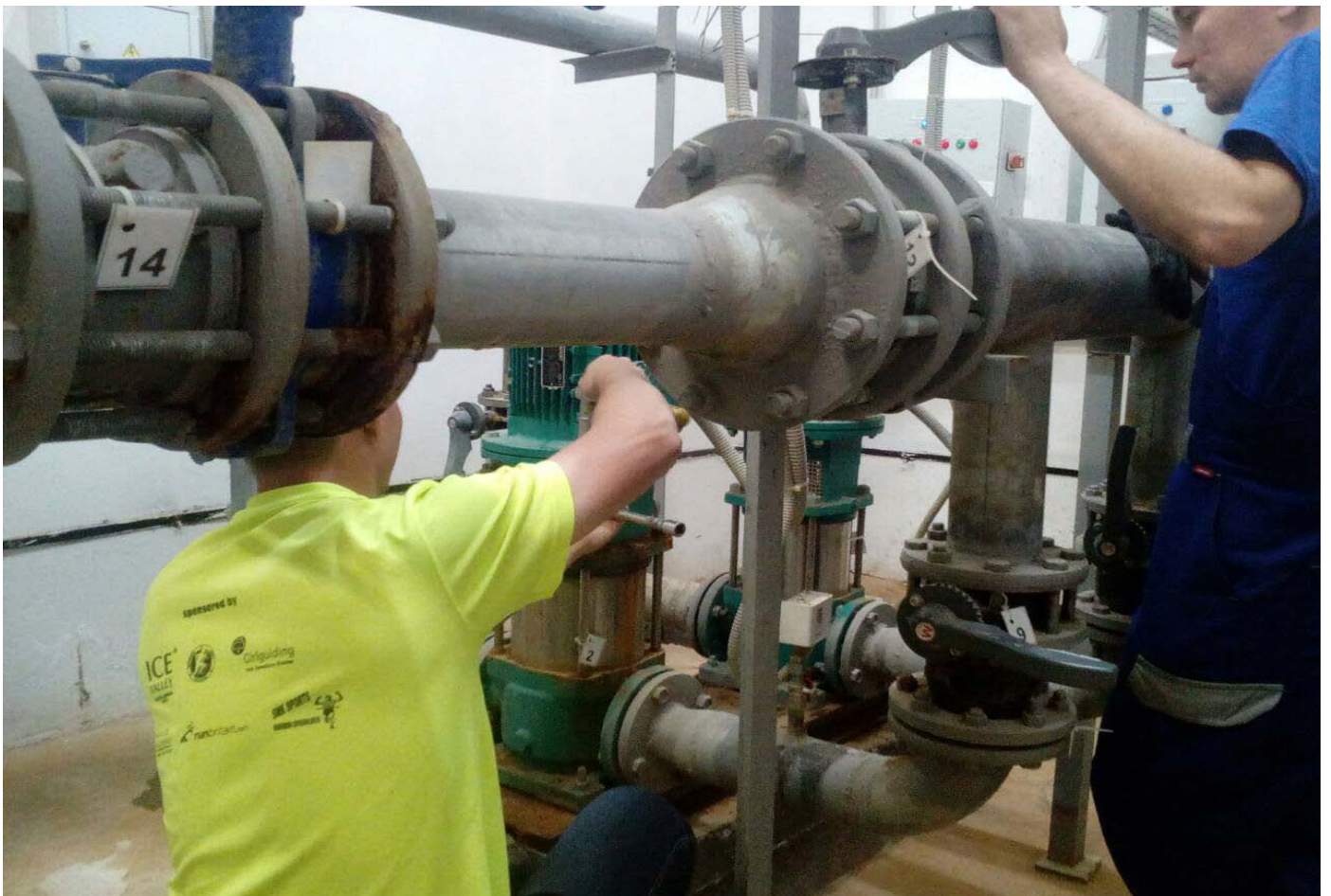
Замена торцевого уплотнения пожарного насоса.