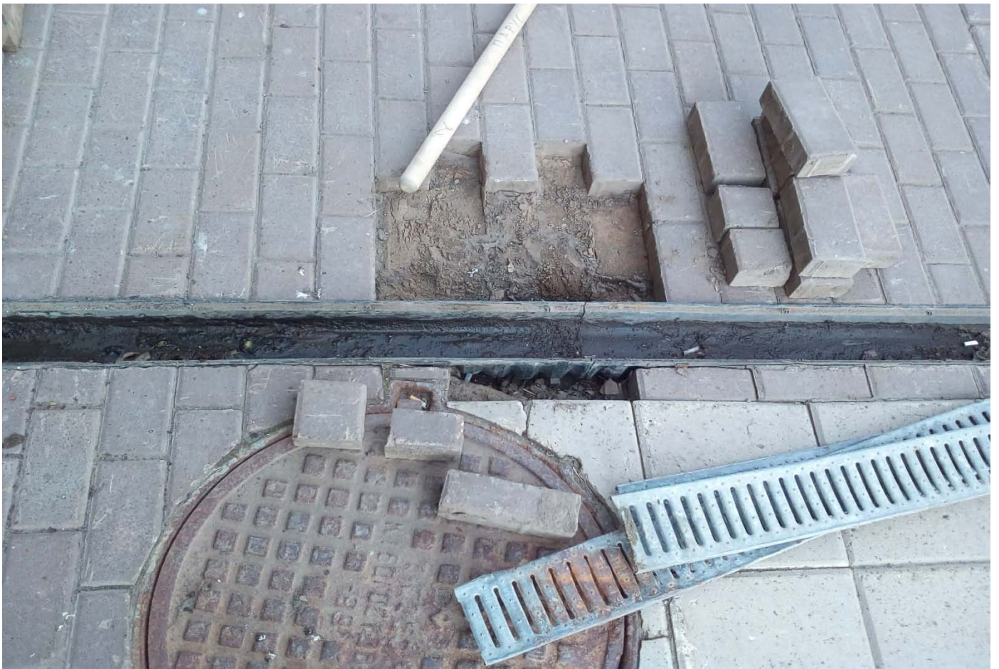
Восстановление провалов брусчатки.