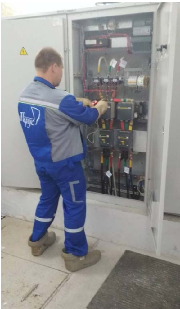
Протяжка контактов силового оборудования.