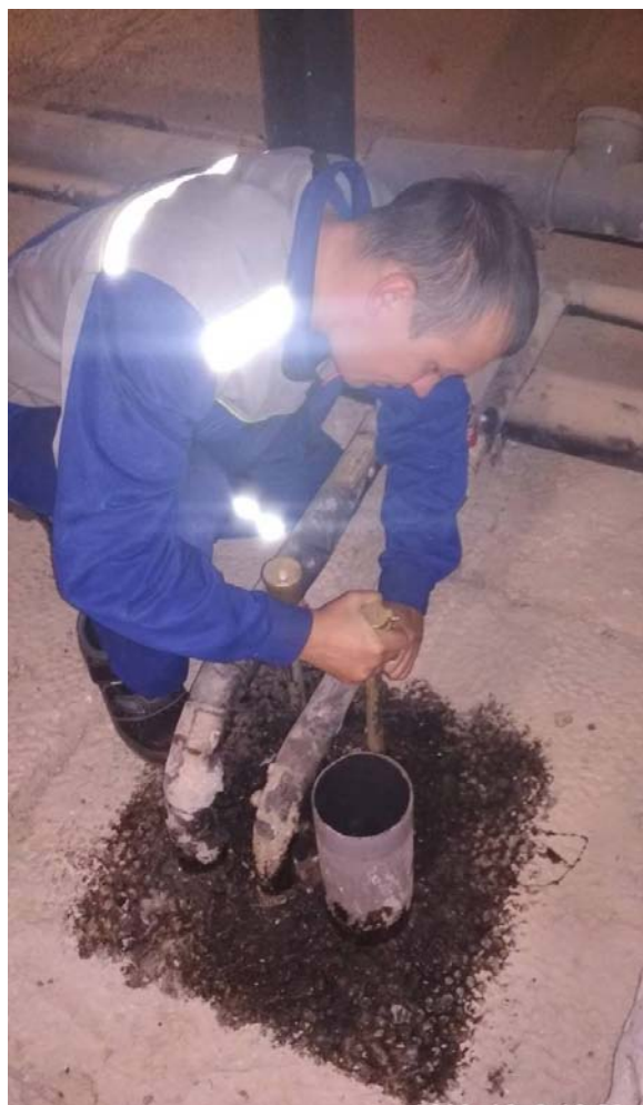
Замена автоматических воздухоотводчиков системы ГВС.