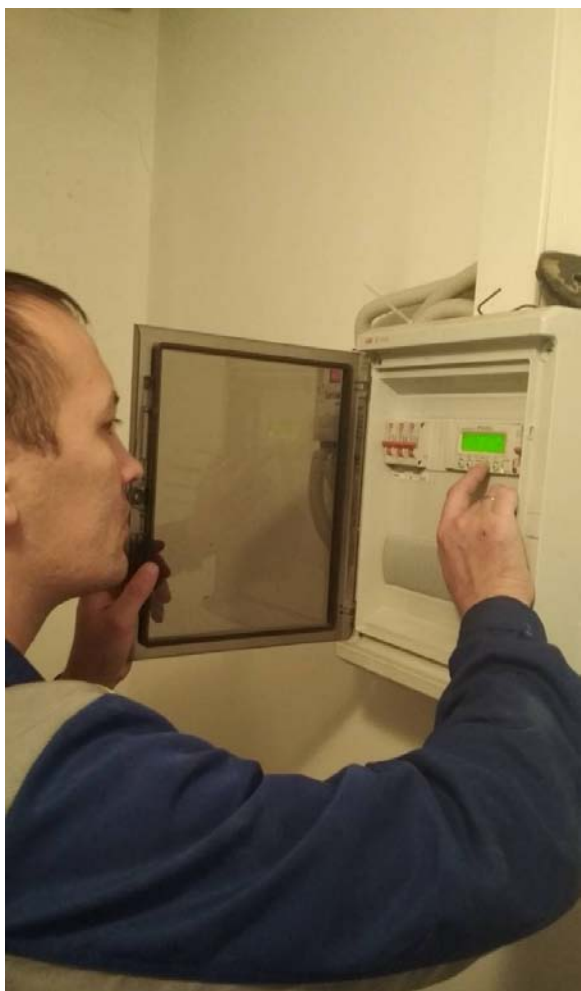
Регулировка автоматики приточных установок.