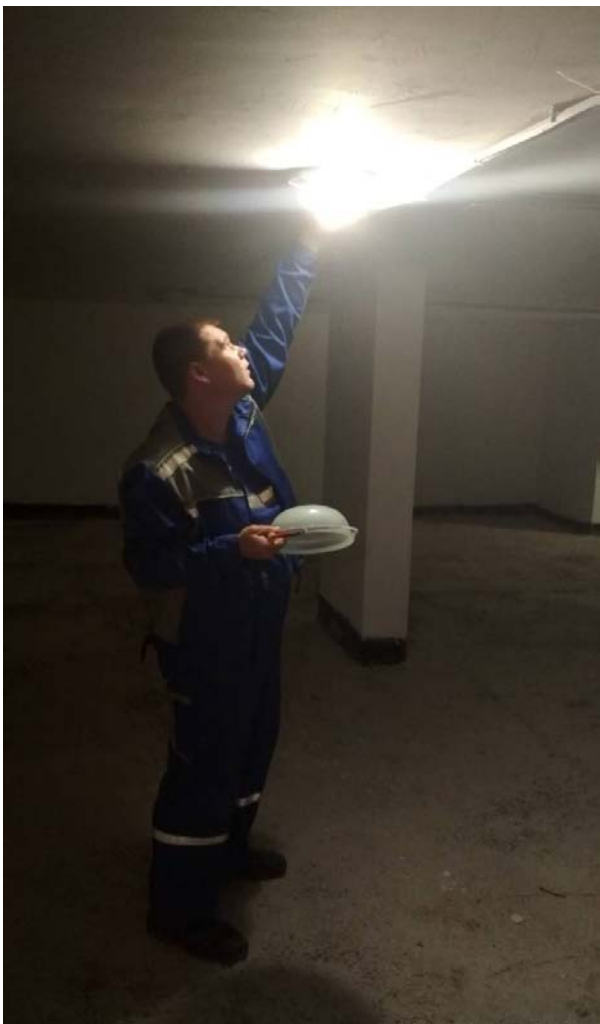
Замена ламп в светильниках.