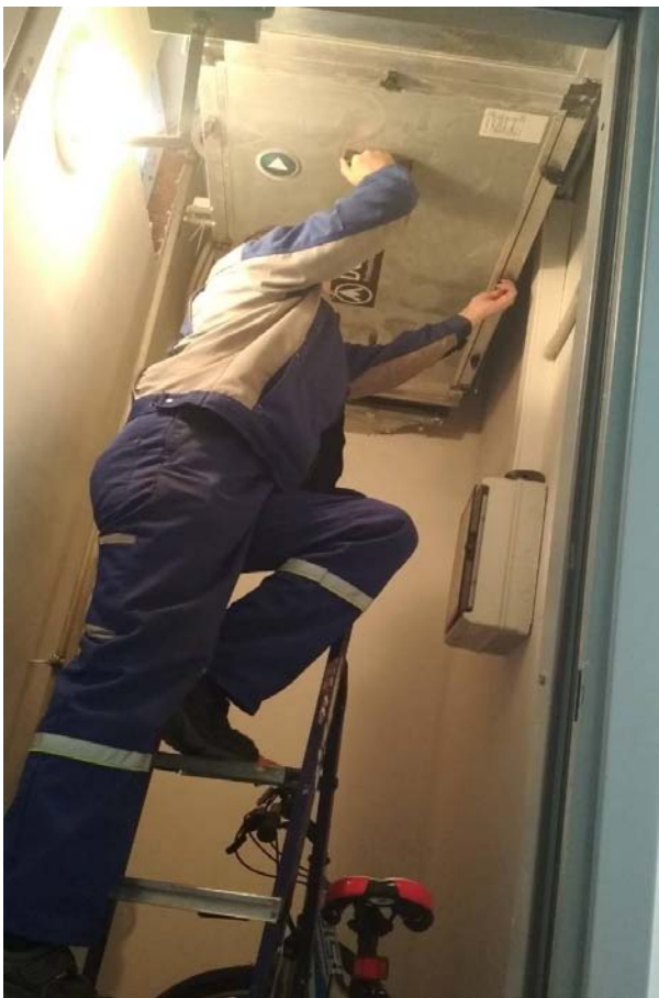
Замена фильтров в приточных установках.