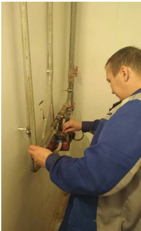
Регулировка циркуляционных насосов теплового контура.