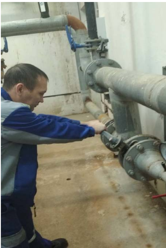
Работы по поверке узла учета ХВС.