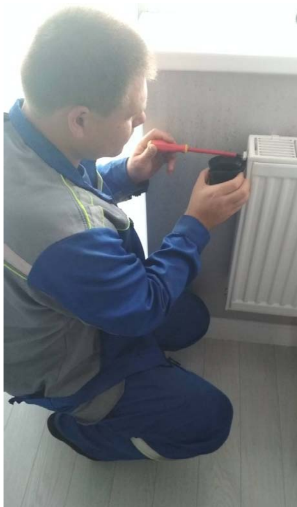
Запуск отопления в квартирах.