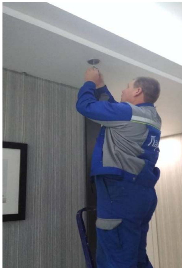
Замена ламп в холле ЖК «Парус».