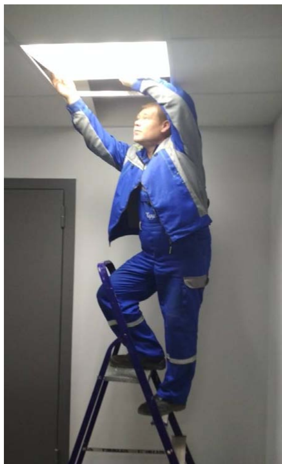
Замена инфракрасных датчиков в светильниках.