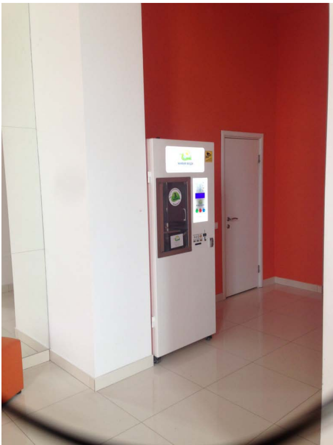
Установка аппарата питьевой воды.