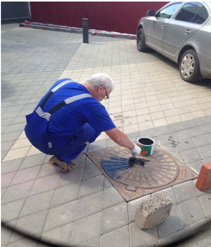
Покраска канализационных люков.