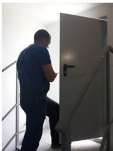
Замена замка на крышу