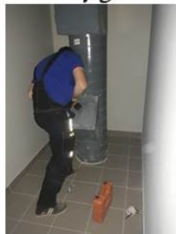
Закручивание дверцы мусоропровода