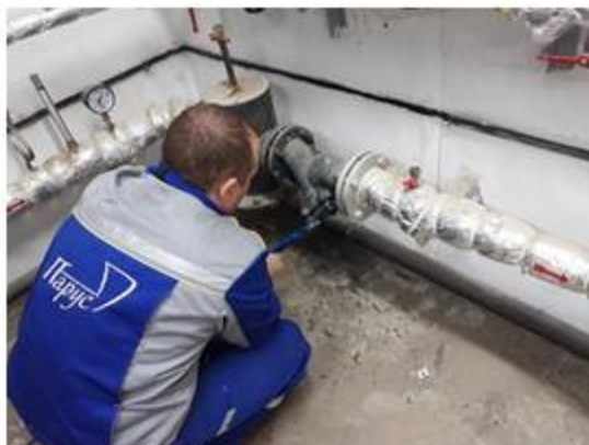
Прочистка фильтра первичного контура теплоносителя