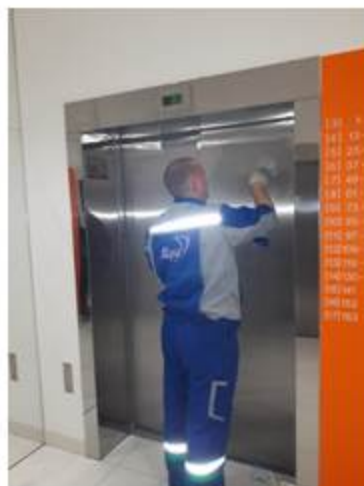
Замена лифтовых табличек