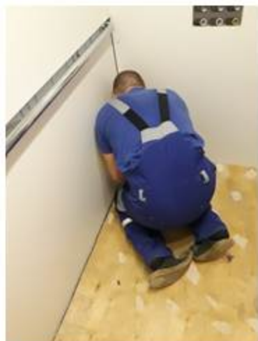
Замена пола в лифте