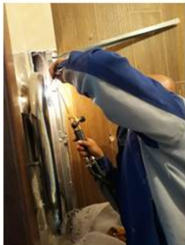
Переварка резьбы полотенцесушителя